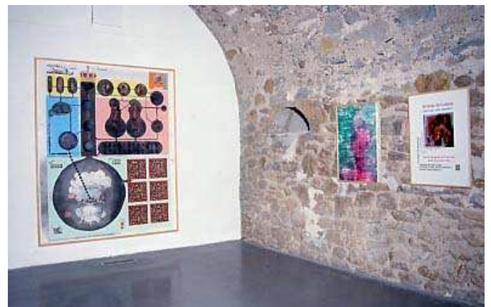
Patrick Van Caekenberg , Alambic , 1994 Collage sur papier, 220 x 176,5 cm / Collection Frac Limousin Martin Kippenberger , Mut zum Druck , 1990 8 affiches extraites d'une série de 28 affiches Dimensions variables / Collection Frac Poitou-Charentes

projet réalisé avec le soutien du Conseil Régional du Limousin, du Ministère de la Culture / DRAC Limousin en coopération avec :