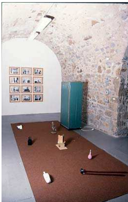
Jordi Colomer , Douze Pensées Intérieurs , 1992 Impression noir sur papier collé sur magazine illustré 12 éléments, 160 x 165 cm / Collection Frac Limousin Didier Marcel , Sans titre , 1995 Moulages en plâtre, matériaux divers sur moquette, 150 x 400 x 200 cm / prêt de l'artiste

L'art de Gilles Mahé se nourrit aussi bien des objets de son quotidien qu'il accumule que de ses rencontres. Sa vie personnelle s'entremêle avec sa vie professionnelle jusqu'à ne plus être distinctes l'une de l'autre. Ainsi, 8 jours chez Sammy Kinge , une installation de 1987, présente des extraits d'œuvres réalisées au cours des années 80 et rassemblées dans l'environnement du salon familial de l'artiste transposé dans la galerie.