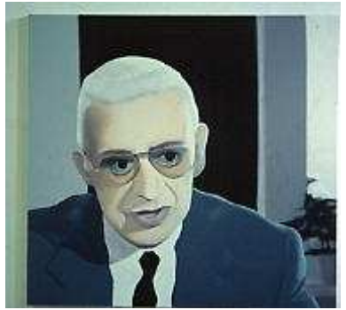
Franck Eon Derrick , 2001 Huile sur toile, 85 x 80 cm Collection Frac Limousin

Enfin, un choix d'œuvres provenant de la collection du Frac Limousin ponctue le parcours en proposant certaines œuvres issues de films, véritables « arrêts sur image » (Wegman, Burden, Signer, etc.) ainsi que d'autres propositions plastiques qui mettent en scène notre relation à la télévision ou en suggèrent un usage différent.