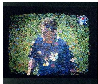
Richard Monnier Je vous dois la vérité : tout votre blanc est en couleur , 1996 Téléviseur recouvert de billes en verre 80 x 80 x 50 cm Collection Frac Limousin