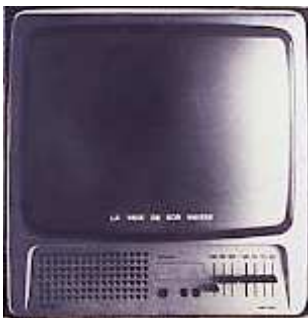
Jaon Rabascall La voix de son maître , 1975 Toile photographique n/b sur châssis 100 x 100 cm Collection Frac Limousin