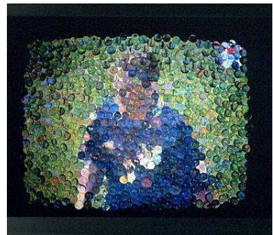
Richard Monnier Je vous dois la vérité : tout votre blanc est en couleur , 1996 Téléviseur recouvert de billes en verre 80 x 80 x 50 cm Collection Frac Limousin