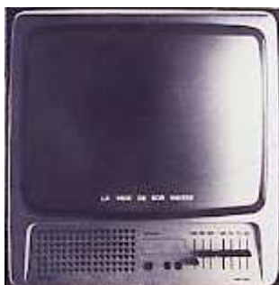
Jaon Rabascall La voix de son maître , 1975 Toile photographique n/b sur châssis 100 x 100 cm Collection Frac Limousin